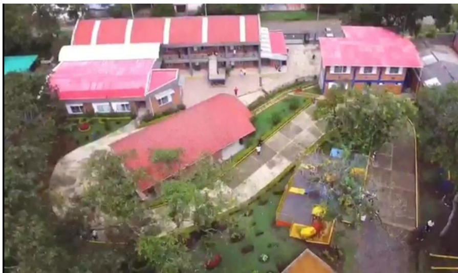
Ilustración 1. Vista Aérea Planta Física F.G.M.C

En el año 2016, la Fundación Gimnasio Moderno del Cauca inaugura su amplia sede campestre, ubicada al norte de la Ciudad Blanca de Colombia, en la Carrera 5 No. 48N-60, la cual inicia su prestación de servicio dotada con una capacidad instalada para albergar hasta 420 estudiantes.