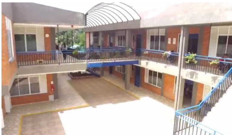
Ilustración 2. Vista Aérea Planta Física F.G.M.C