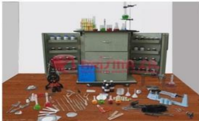
Ilustración 7. Foto de Laboratorio Modular de Química

Con lo anterior, se brindan las condiciones requeridas para que las clases sean altamente satisfactorias para nuestra comunidad estudiantil generando ambientes académicos favorables en pro de nuestro objetivo visional: “La Fundación Gimnasio Moderno del Cauca será en el 2025 una Institución líder, competitiva e innovadora, a través de la construcción permanente del crecimiento y reconocimiento Institucional garantizando una educación integral, fomentados a través de la idoneidad de cada uno de sus colaboradores y en el cumplimiento de altos estándares de calidad, en pro de la satisfacción de la familia Gimnasta. “Crecer, un Compromiso Gimnasta”.”