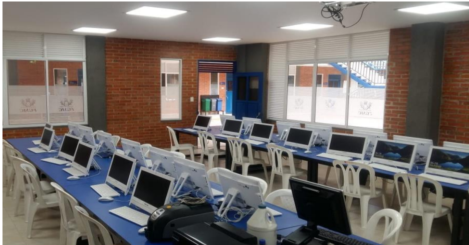
Ilustración 5. Sala de Computo