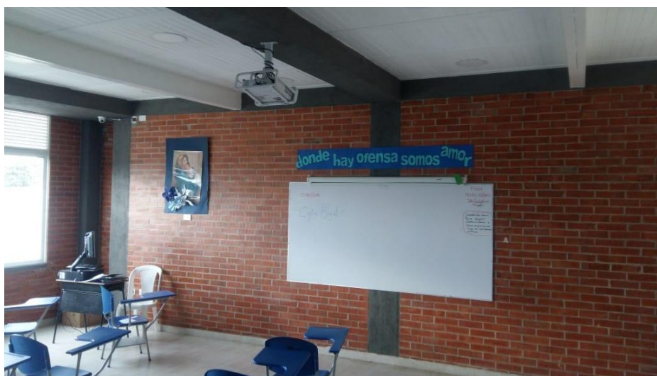
Ilustración 4. Aula de Clase