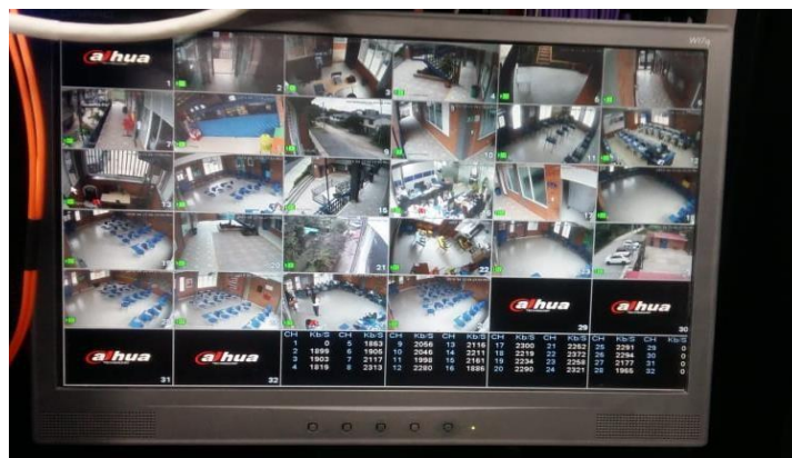
Ilustración 6. Circuito Cerrado de Televisión